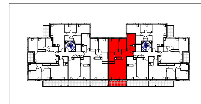
TABLEAU DES SURFACES HABITABLES